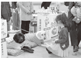
盲導犬とのふれあいコーナーの様子

三井住友海上しらかわホールは、音楽による社会貢献活動の一環として、2016年よりセントラル愛知交響楽団と盲導犬支援のチャリティーコンサートを開催しています。