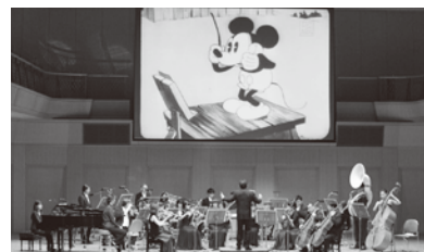
前回の公演写真「指揮者ミッキー」より

1983年中部地区では2番目となるプロオーケストラとして「ナゴヤシティ管弦楽団」を発足。1996年より三井住友海上しらかわホールの協賛を受け同ホールを拠点とする。1997年岩倉市の好意による練習場の無償借用や事業補助を機会に、セントラル愛知交響楽団と名称を変更。2009年4月より一般社団法人として再出発する。2014年4月から音楽監督にチェコの名匠レオシュ・スワロフスキーが就任。1996年「平成7年度愛知県芸術文化選奨文化賞」、2005年「平成16年度名古屋市芸術奨励賞」受賞。