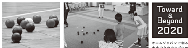
※[オリンピック・パラリンピック等経済界協議会]Facebookをご登録ください!⇒https://www.facebook.com/kyougikai2020/

「ボッチャ」はヨーロッパで生まれた重度脳性麻痺者もしくは同程度の四肢重度機能障がい者の為に考察されたパラリンピック正式種目です。今回「オリンピック・パラリンピック等経済界協議会」の活動の一環として、2020東京パラリンピック競技種目「ボッチャ」の体験会を開催致します。名古屋で「オリンピック・パラリンピック」を感じてください!