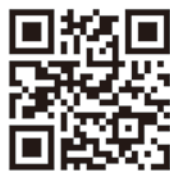
【メールによる投票方法】のQRコード